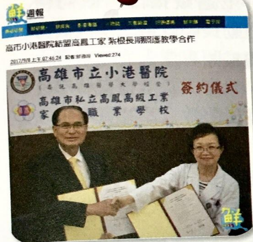
▶ 小港醫院與高鳳工家結盟，獲得鮮週報報導。