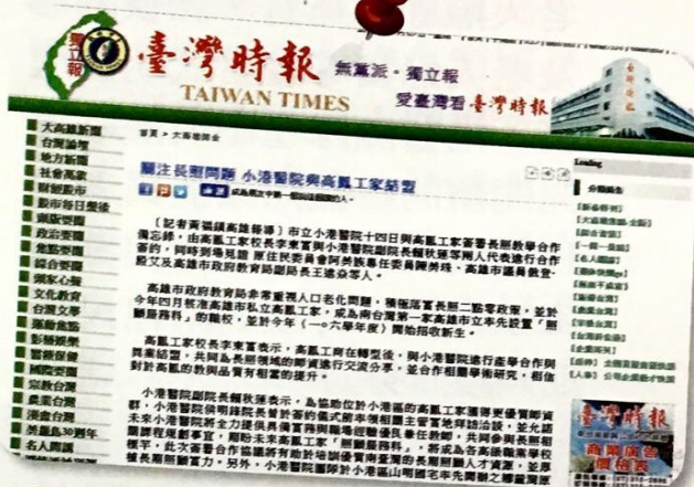
▶ 臺灣時報報導小港醫院與高鳳工家合作長照教學。