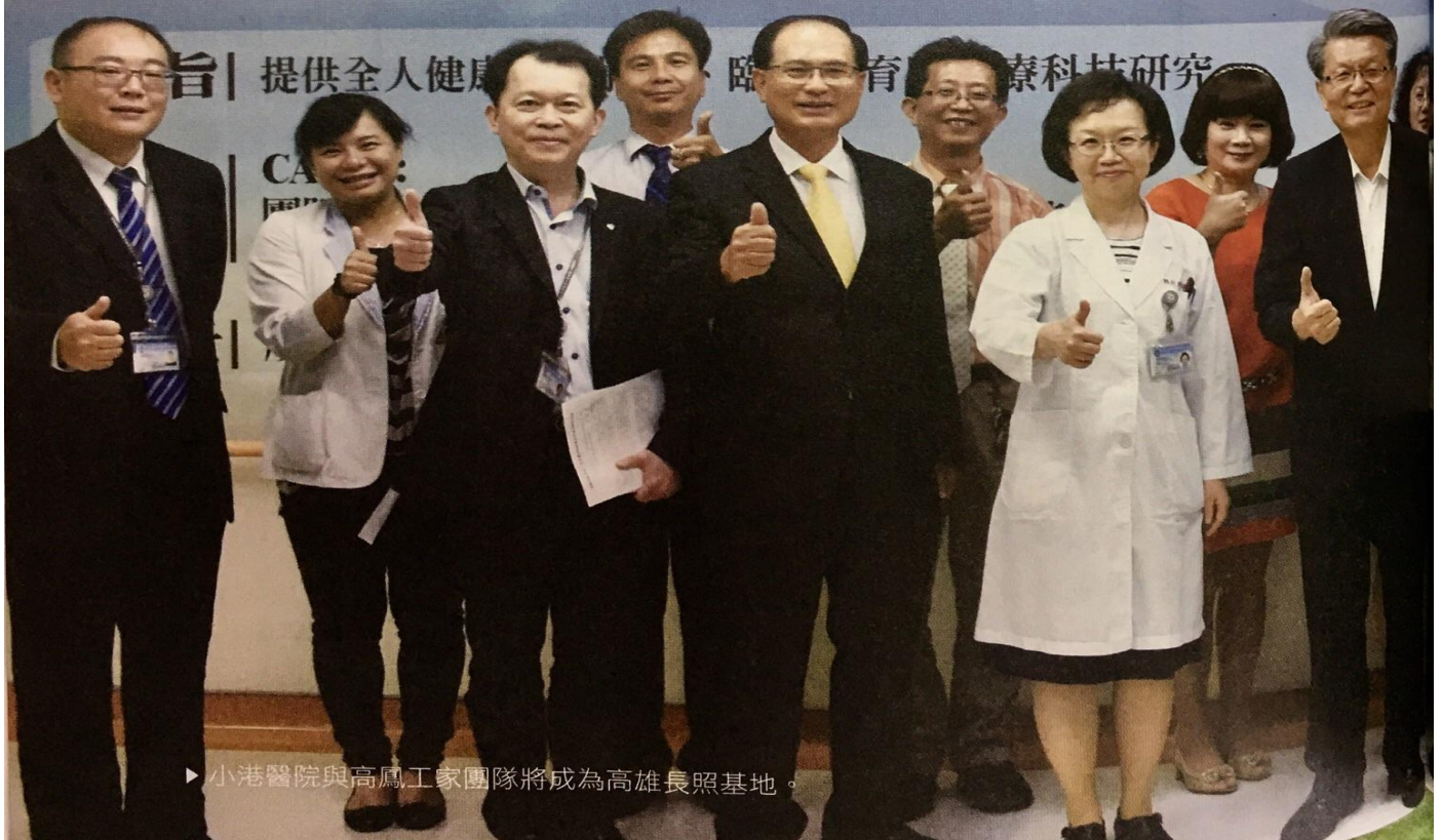
▶ 小港醫院與高鳳工家團隊將成為高雄長照基地。